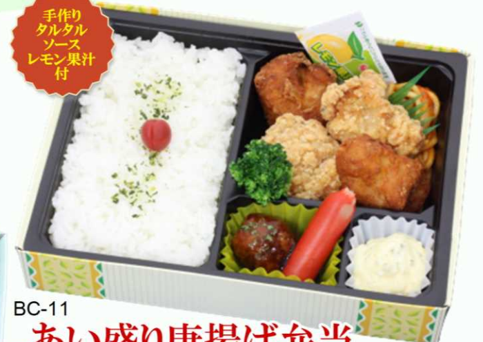
BC-11 あい盛り唐揚げ弁当 『から揚げ』と『竜田揚げ』ボリューム満点! 相性抜群のソースを添えて・・・ 大人気のお弁当