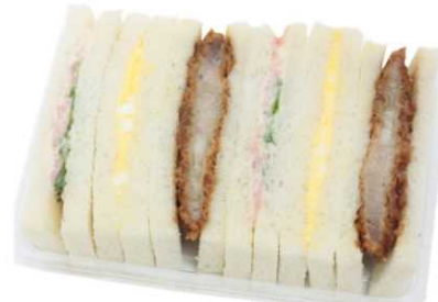
BC-42 三元豚ロースカツ ミックスサンドBOX