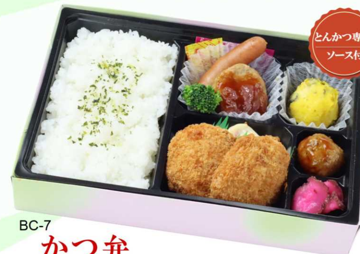
BC-7 かつ弁 新登場!! 二枚のヒレかつにハンバーグ、ウインナー、ミートボール サラダも添えた肉系メインのお弁当