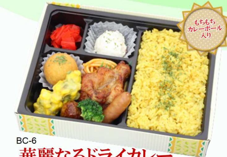
BC-6 華麗なるドライカレー 待望のドライカレー弁当 自慢のウイングチキンとカレーボール 相性抜群のおかずを添えて・・・