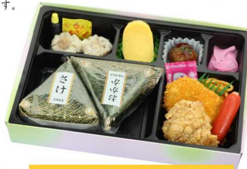
BC-23 おむすびスペシャル