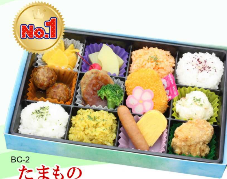
BC-2 たまもの 大人気の十ニマス弁当 バラエティー豊かなご飯とおかずを盛り込んだお弁当 ロングセラー商品!