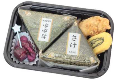
BC-21 おむすび (い)