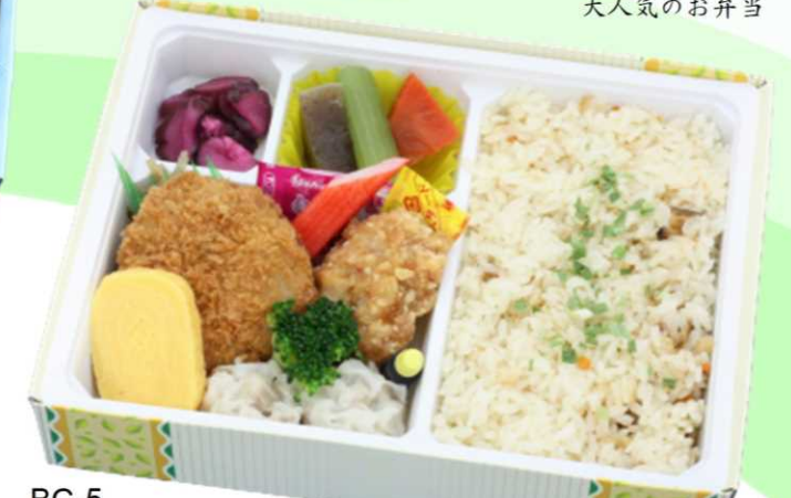
BC-5 ヒレかつチャーハン弁当 ヒレかつ、鶏竜田揚げ、焼売がおかずのこだわり満点 特製五目チャーハン弁当