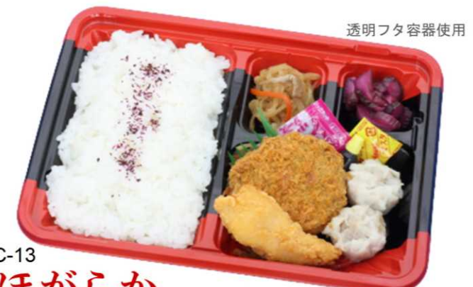
BC-13 ほがらか メンチカツとチキンスティックがメインのお手軽和風弁当