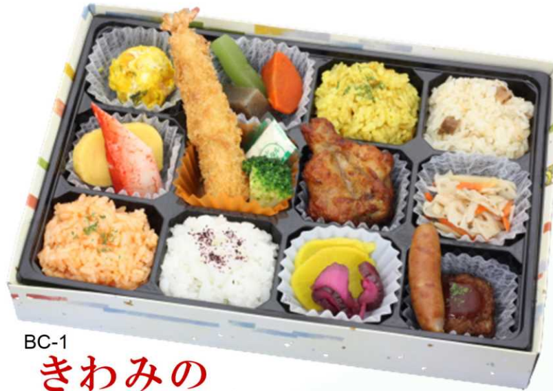
BC-1 きわみの 人気の食材を贅沢に盛り込んだ 自慢の豪華絢爛ハイクラス弁当