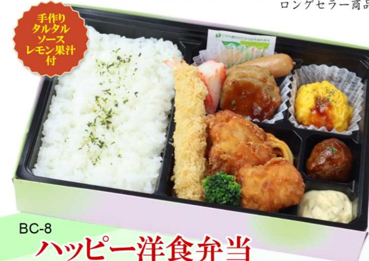
BC-8 ハッピー洋食弁当 鶏の唐揚げ&エビフライとミニハンバーグ ふわふわ卵を添えたいいところ取りのお弁当