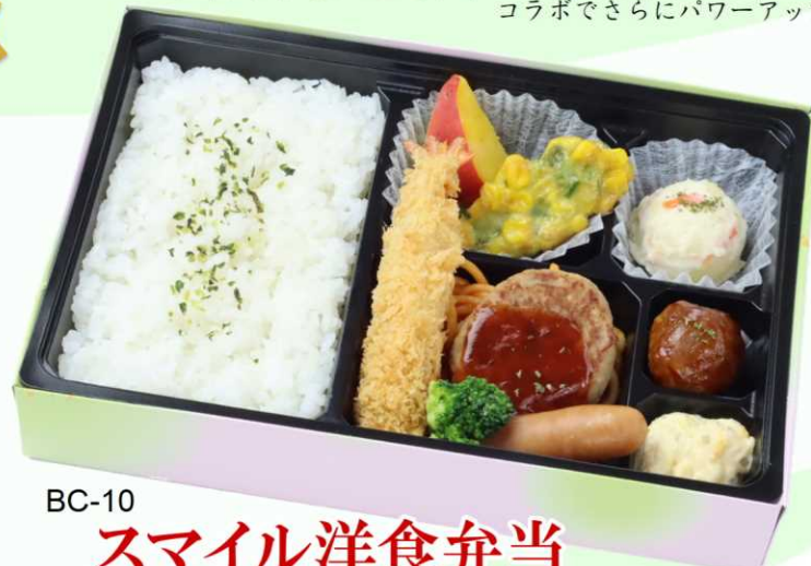
BC-10 スマイル洋食弁当 エビフライとハンバーグ 食べやすく人気のおかずを盛り込んだ洋食弁当