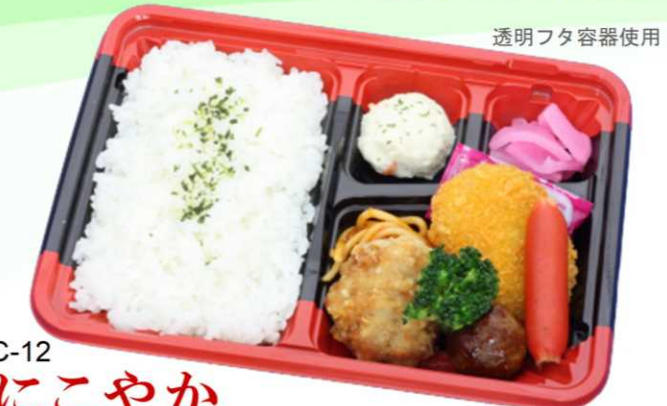
BC-12 にこやか 鶏竜田揚げとスイートコロケがメインのお手軽洋風弁当