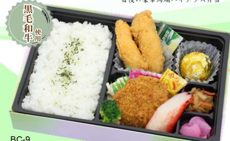
BC-9 牛メンチとチキンスティック弁当 黒毛和牛を使用したメンチとフライドチキンスティック バランスの良いおかずを添えた和風弁当