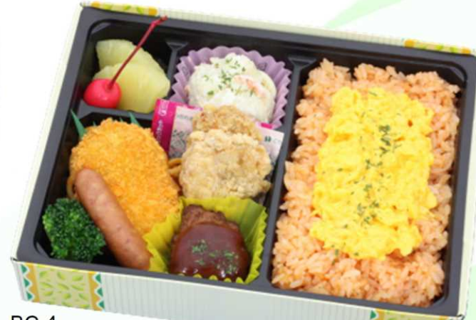
BC-4 ふわとろタマゴの洋食弁当 ケチャップライスにふわふわ卵をのせて・・・ 大人気のロングセラー商品!