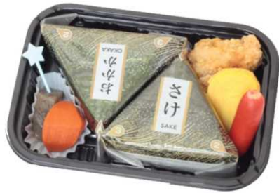
BC-22 おむすび (ろ)